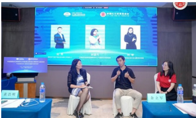
案例分享互动交流环节

4月27日，2025年CN计划启动会在北京顺利举行。本次会议汇聚了多家意向申请2025年CN计划的社会组织及团队以及来自气候、能源、传播领域的权威嘉宾，近60人以线下或线上的形式参与，围绕可再生能源“破圈”传播展开深入探讨与交流，共同分享经验、激发思路，探寻创新传播路径，助力“可再生能源”议题走向更广泛的公众群体。