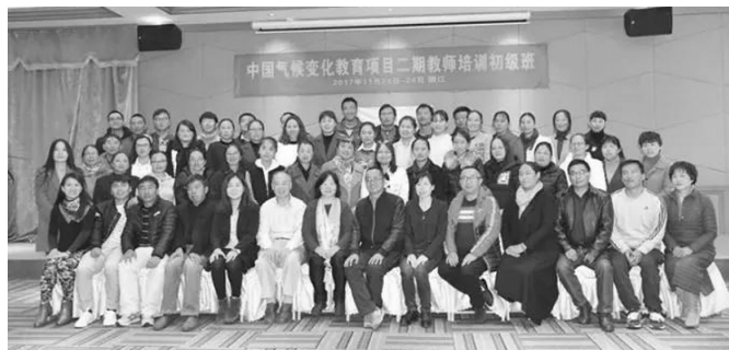
图为参会人员合影