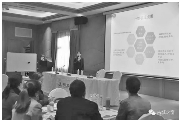
图为会议现场照片

区教育局相关负责人表示，加强环境保护是我国的基本国策，习总书记说“绿水青山就是金山银山”，党的十九大报告也提出开展绿色学校创建行动，可见校园的环保教育很重要、很关键。一直以来，古城区不断创新环保教育方式，涌现出了很多优秀的环保教育案例，比如漾西完小的“人类的好朋友：动物与植物”、新文完小的“地球上的水”等校园环保课程得到了学生、家长、社会的广泛好评。在下一步工作中，区教育部门将继续开展好校园环保教育，培养和引导学生积极参与到环保行动中来，积极推进丽江环境保护模范城市创建工作。