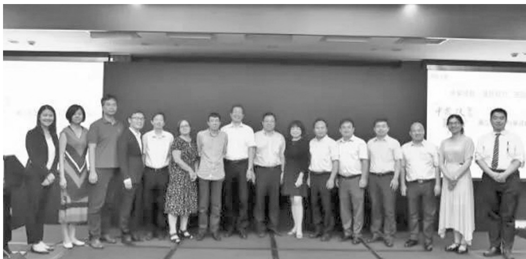
图为与会发言嘉宾合影