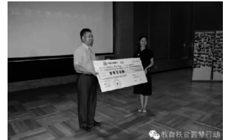
图为安徽芜湖佳宏新材料有限公司向项目捐赠十万元