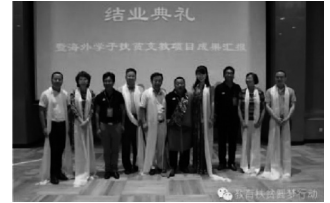
图为青海校长为嘉宾献送哈达