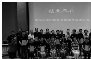
图为成果汇报会现场