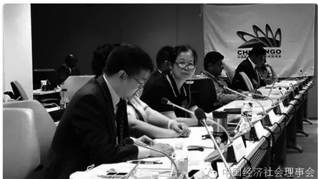
以上三副图为圆桌会议现场