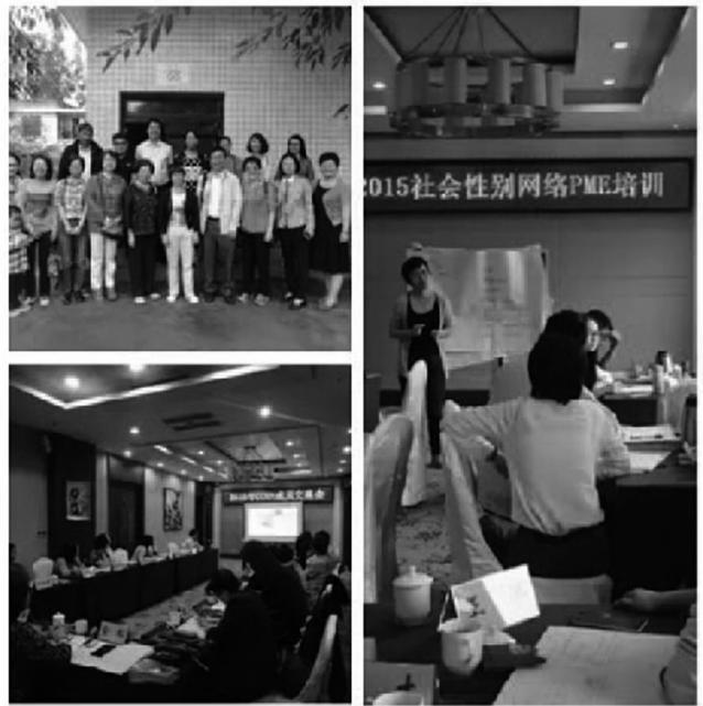
图为中国民间社会性别网络成员交流会活动照片

此次活动为成员机构之间展开经验分享与交流合作提供了良好机会，为未来更好发挥中国民间组织在推动社会性别主流化过程中的积极作用打下基础。