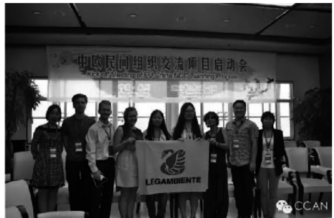
图为中欧民间组织互换项目启动会在杭举行