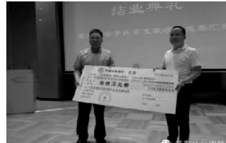
图为四川德赛尔化工实业有限公司向项目捐赠十万元