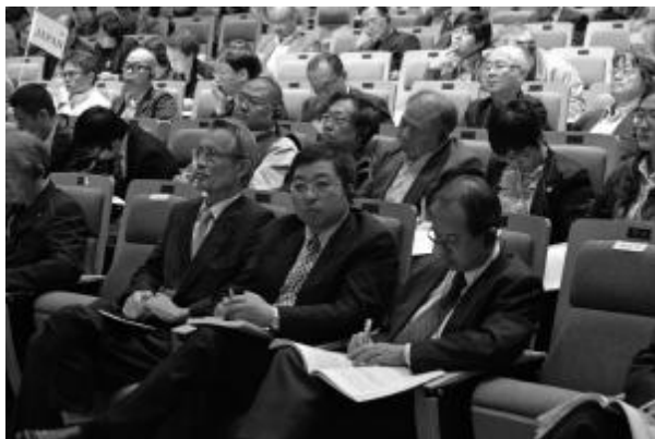
第五届东亚民间社会论坛2014会场场景

企业社会责任（英文：Corporate social responsibility，以下简称CSR）概念的界定，是指企业在其商业运作里对其利益攸关者承担的社会责任。企业社会责任的概念是基于商业运作必须符合可持续发展的基本原则，企业除了考虑自身的财政和经