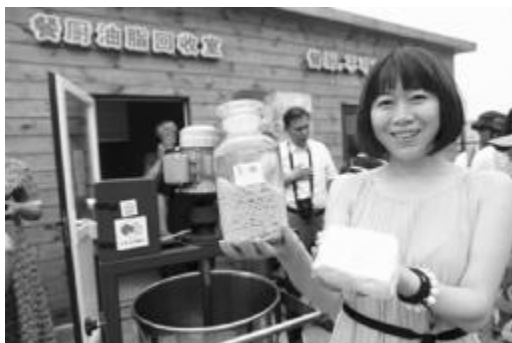
废弃食用油做肥皂