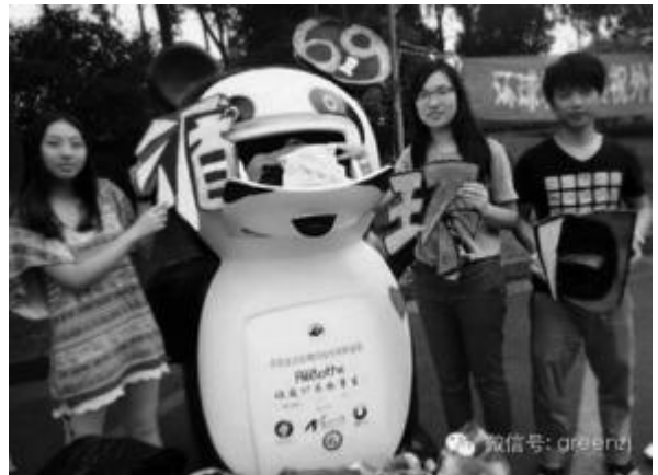
杭州衣物重生活动

绿色浙江在2014年全国低碳日期间，以秋水苑变形记、衣物重生项目、绿色浙江循环日三大重点活动开展了为期近3个月低碳日活动。其中，6月10日以衣物重生废旧衣物回收再利用杭州市滨江站启动为重心，同时开展跳蚤市场活动，举行低碳日当日活动；6月19日和9月16日，绿色浙江自创"绿色浙江循环日"在高校、社区、商业中心进行低碳日活动，并在中国杭州低碳科技馆联合浙江电台交通之声、杭州市科协、团市委等主办"916绿色浙江循环日"活动，并创作循环日歌曲《一起循环》、召集绿色浙江公益大使录制宣传带等。7月，绿色浙江联合浙江卫视在杭州市秋水苑社区开展为期一个月的垃圾分类教育，倡导人们改变垃圾处理习惯，节目由浙江卫视每天播出。