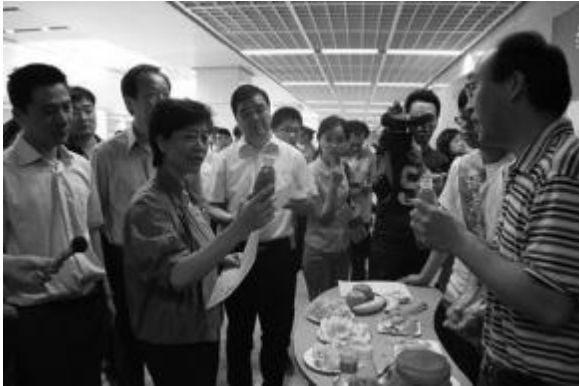
南京环保酵素推广

江苏绿色之友围绕建设低碳社区主题，开展了一系列活动。包括：社区环保讲座交流。请环保专家、环保知名人士做环保的专题讲座，并与市民圆桌座谈交流，开拓市民的眼界、普及环保知识、增强环保意识；健康好水让我们的身体过上低碳生活。在社区安装健康饮水设备，让居民饮用，感受水对人体健康状况的重要性，共同关注饮水卫生、普及科学饮水知识，促进改善饮水水质，推广新的健康饮水方式；"衣"往情深 奉献爱心 "碳"明未来。搭建社区旧物交换平台，鼓励旧物的循环利用，通过闲置物品的捐赠、互助、交流活动，倡导爱心、节俭、绿色、环保、循环使用的生活理念、