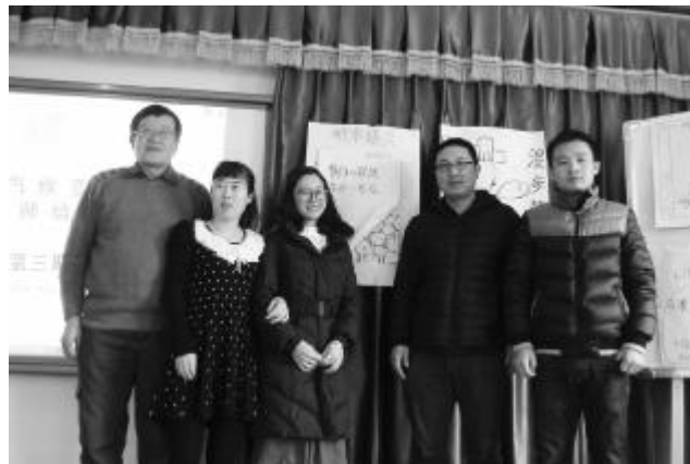
小组展示海报设计