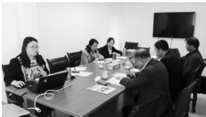
在江西赣州慧聪儿童康复训练中心进行个性化辅导