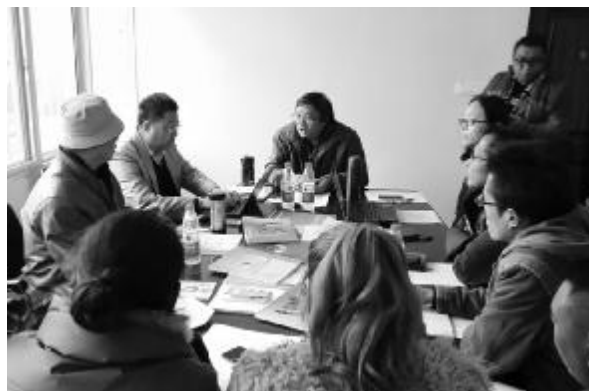
在四川凉山彝族妇女儿童发展中心进行个性化辅导